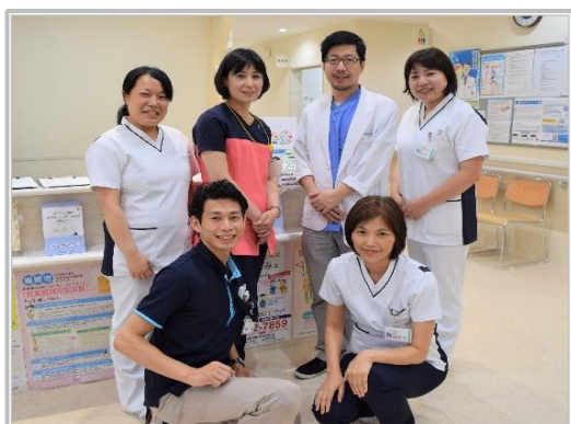
博多おおぞらクリニック 訪問診療チーム

私たちは、患者様、ご家族様の気持ちを受け、住み慣れた場所で療養生活を送ることができるよう診療体制を整えています。医師や看護師が、患者様のお宅に定期的に訪問し、計画的かつ、継続的な医学管理や経過診療を行います。